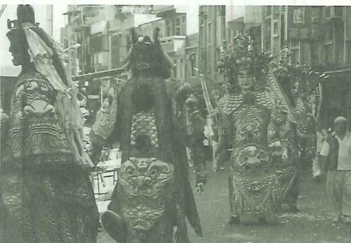
▼農曆五月初六淡水清水祖師廟會陣頭遶境祈福

今年適逢里長、鎮民代表選舉，更是結合了這個重要慶典，各家候選人紛紛趕搭此班順風車造勢，鞭炮鑼鼓聲不斷，若非親眼所見，真是難以想像的熱鬧。