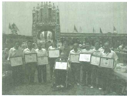
▼大道公華誕在北新莊賽神豬盛況

今年五月初六清水祖師遶境活動，參加遶境民俗陣頭約有百餘隊伍、上千人次，朝香及參與民眾可能高達萬餘人次。目前淡水鎮不過十幾萬人口，祖師廟的活動吸引如此大規模的活動人員每年持續，頗為壯觀。