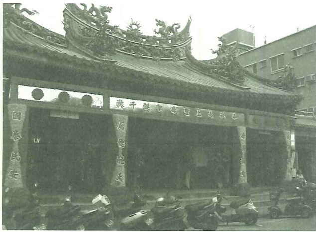
▼福佑宮廟前佈置鮮花牌樓，準備迎接媽祖聖誕慶典

淡水兩大民間信仰圈，一個是台灣社會較為普遍的佛、道教信仰，一個是西方傳入的基督教信仰。在佛、道教信仰方面，譬如每年農曆三月十五日有八庄大道公祭典、農曆三月二十三日媽祖生日、農曆五月初六有清水祖師遶境慶典等；而在基督教信仰方面，每年六月二日淡水鎮公所都會和長老教會合辦馬偕日活動。這些民間信仰與慶典活動都為淡水帶動熱潮，在今日工商社會中，淡水還依然能夠維持這麼活絡與多元的民間信仰與慶典，確實非常難得。