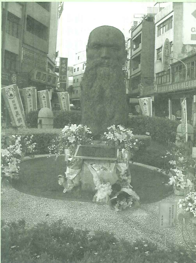
經常有參觀民眾會特意到老街的馬偕紀念雕像獻花

今年的馬偕日除了走馬偕街還有：淡水馬偕街百年老照片展、馬偕音樂節、馬偕街街民獻寶盒、滬尾偕醫館義診、連易宗「淡水懷舊影像展」等活動。可惜，連日豪雨影響不少活動熱度，淡水教會江牧師表示，此次活動累積不少經驗，明年將會擴大舉行，也會提高參與層級，讓馬偕博士和教會的人文特色，帶動淡水的文化活動更朝向國際化。