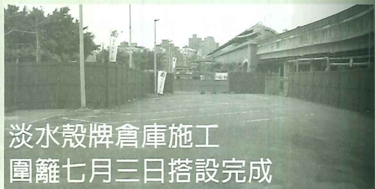
淡水殼牌倉庫施工圍籬七月三日搭設完成

公民會議模式係源自於北歐的審議民主經驗，相較於當今台灣民主政治發展的過度民主化，如能透過資料研讀、專家諮詢、理性批評以及共善取向的討論，尋求多元社會的共識和最佳對策，或許更能貼近民主政治的理想。相關訊息請上公民會議部落格： http://blog.yam.com/tconcon （文/郭于瑞）