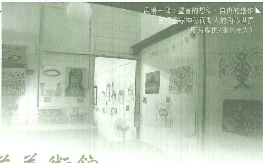
展場一隅：豐富的想像、自由的創作 呈現畫家神秘而動人的內心世界